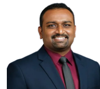
Pastor Kalai Full Gospel Assembly Kuala Lumpur

School of Ministry (SOM) is a certificate program that features a range of courses, ranging from books of the Bible, Theology, Leadership, Ministry Skills and Spiritual Formation, taught by experienced and gifted ministers. SOM aims to inspire faith and help believers grow their love for God and His Word.